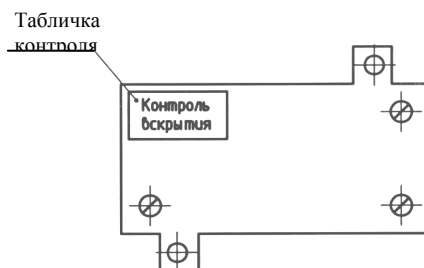
ПН7Б, ПН7Н, ПН8